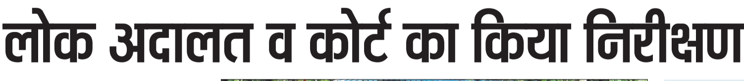
हरिभूमि न्यूज ►► जशपुरनगर