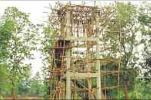
निर्माणधीन पानी टंकी।

जनता को भुगतना पड़ रहा है। ठेकेदार द्वारा गांव में नल लगाकर छोड़ दिया गया है लेकिन पानी टंकी का काम अधूरा है। ऐसे में ग्रामीण दोढ़ी, कुंए का पानी पीने को मजबूर है। ग्रामीणों द्वारा लगातार शिकायत किए जाने के बाद भी अब तक निर्माण कार्य पूर्ण नहीं हो पाया है। बता दें कि विकासखंड के ग्राम पंचायत नवकी का जल जीवन मिशन योजना के तहत हर घर नल जल योजना के तहत पाइप लाइन विस्तार व पानी टंकी बनाने का काम चल रहा था। निर्माण कार्य प्रारंभ होने के बाद ठेकेदार ने लगभग डेढ़