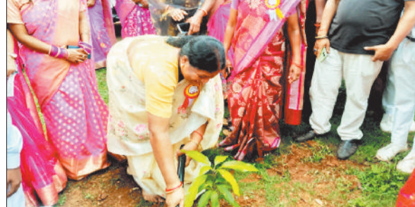
पौधा रोपण करती विधायक रायमुनि भगत।