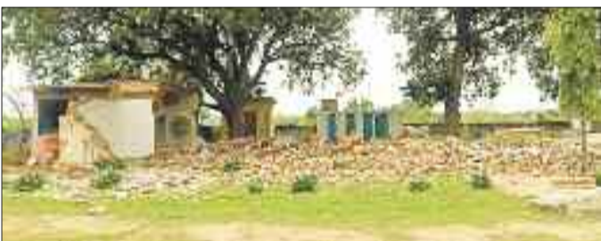
दहाए गए जर्जर स्कूल का मलबा।