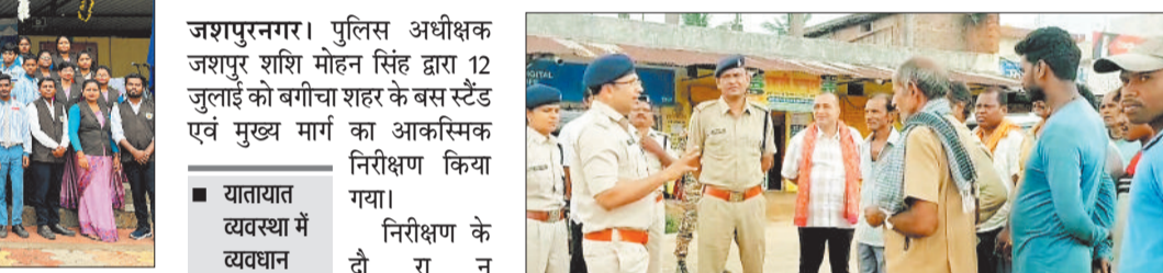
लोगों को समझाए देते एसपी।

इधर-उधर बेतरतीब वाहन खड़ी कर यातायात व्यवस्था में बाधक बन रहे एवं दुर्घटना को बढ़ावा दे रहे